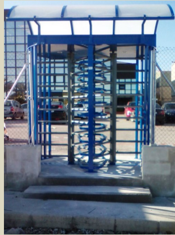
Industria en Cheste. Valencia