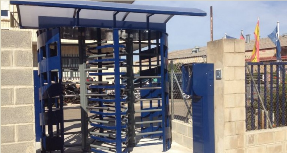
Industria en Picasent. Valencia