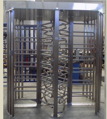
Industria en Valladolid