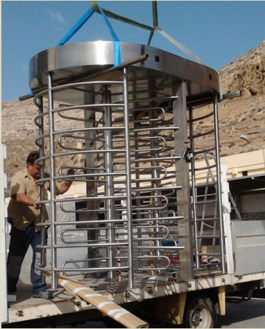
Puerto de Almería. Muelle Pesquero