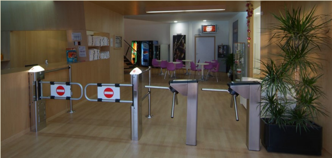
Acceso Club Deportivo. Figueras. Girona