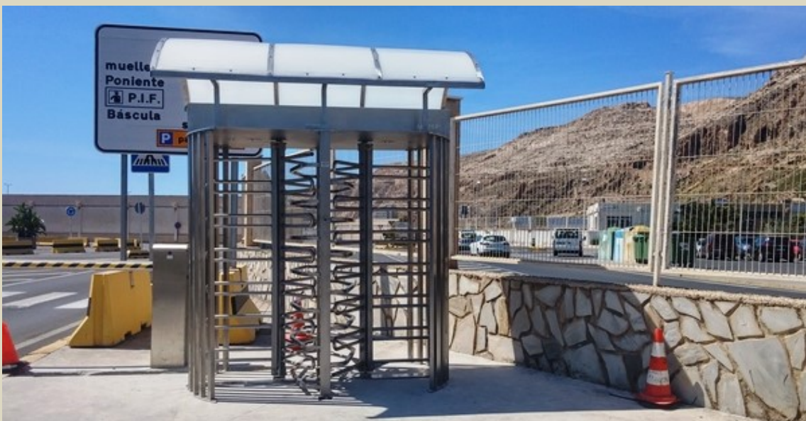
Puerto de Almería. Zona Industrial