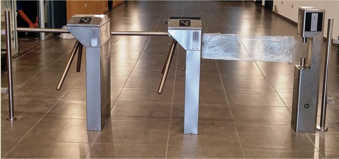
Museo de Belenes. Molina. Antequera