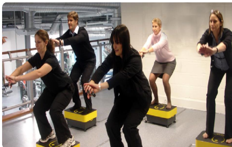
Clases Colectivas Fitness Express