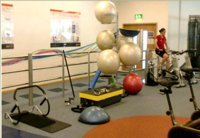
Espacios bien aprovechados